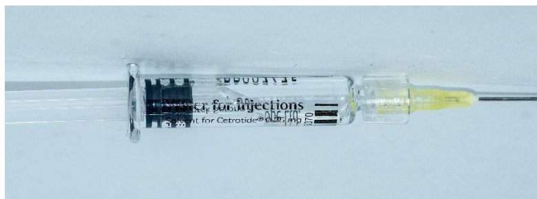
Figura 3. Pistonul scos complet în afară, cu pierderea sterilității produsului